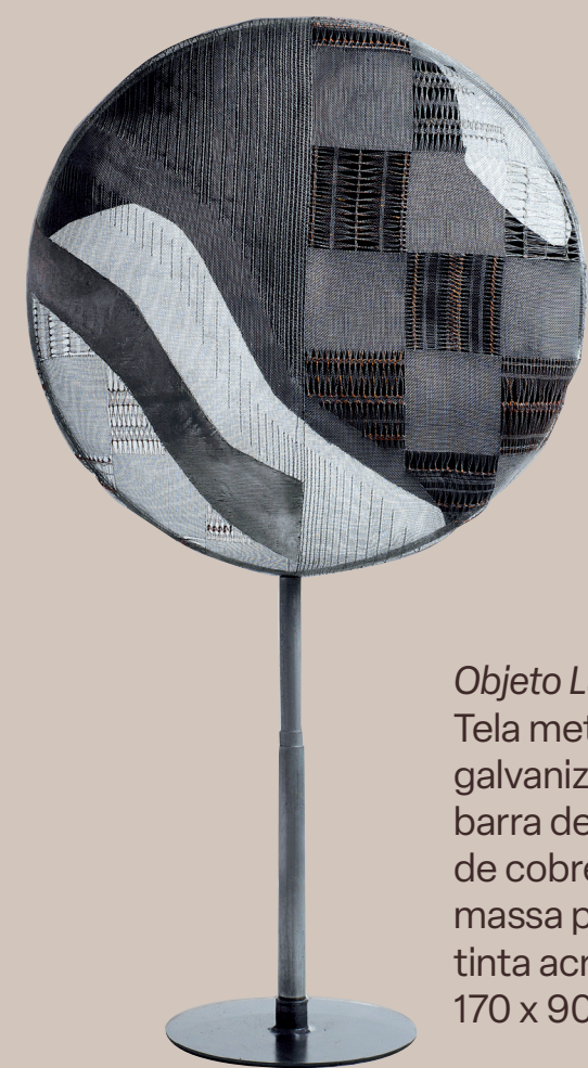
Objeto Lunar II , 1992 Tela metálica galvanizada, tubo e barra de ferro, fios de cobre e bronze, massa plástica e tinta acrílica 170 x 90 x 30 cm

Ressonâncias , 1996 Tela e fibra metálica galvanizada, ferro, massa plástica, tinta acrílica e spots 280 x 500 x 500 cm